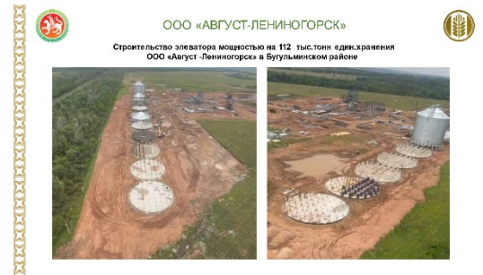
ООО «АВГУСТ-ЛЕНИНОГОРСК» Строительство элеватора мощностью на 112 тыс.тонн един.хранения ООО «Август -Лениногорск» в Бузульском районе

На сегодня первый этап строительства - цех приемки и отгрузки продукции и блок складов с оборудованием и монтажом технологического оборудования на 4000 тн завершен. По второму этапу картофелехранилище на 4,5 тыс.тонн планируется завершить до конца текущего года.