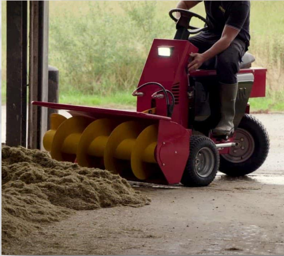
Скребок для удаления навоза